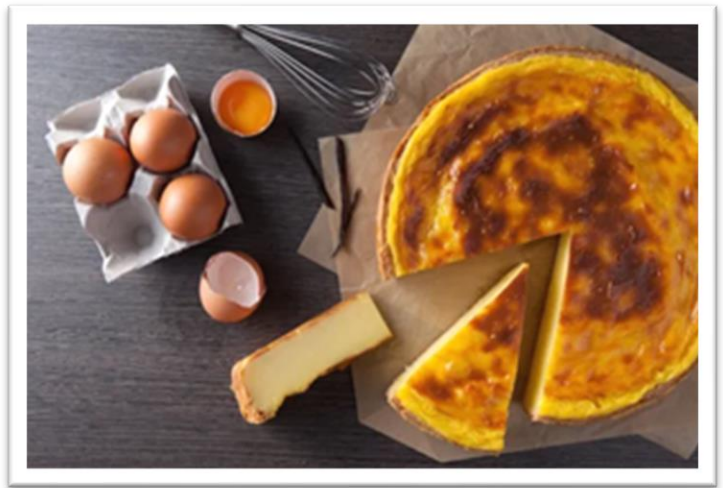
« Flan pâtissier ☞ »

Compte tenu des difficultés d'approvisionnement, les menus sont susceptibles d'être modifiés